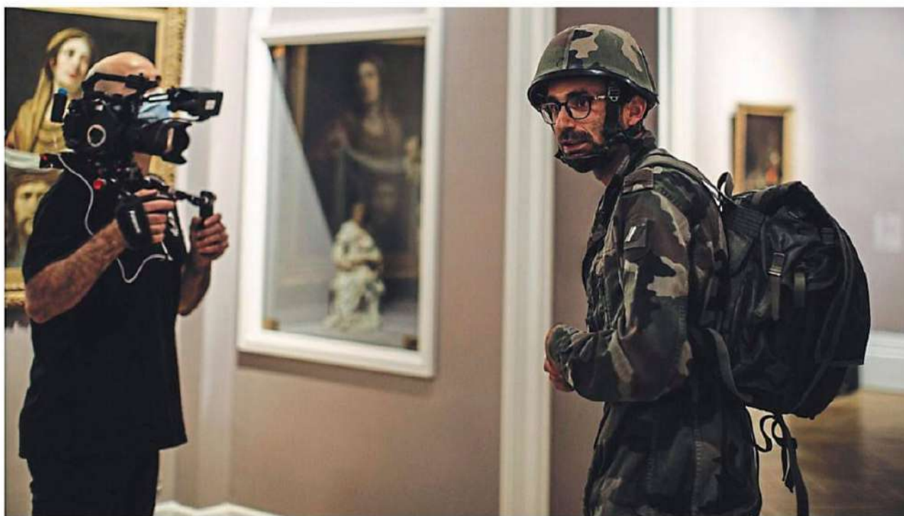
Le Mans, musée de Tessé, mardi. Le spectacle « Safari Experience » de la compagnie Little Garden – Fabrizio Solinas, tournée au musée de Tessé, sera diffusé lors de la soirée de samedi.

Jusqu'à dimanche, La Nuit du Cirque propose une expérience inédite aux spectateurs qui pourront découvrir, depuis chez eux, cinq spectacles de cirque et un concert, dont deux en direct.