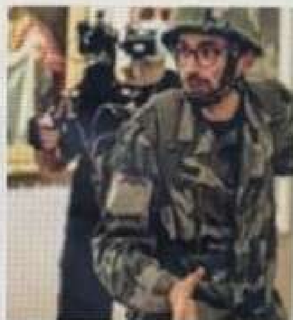
Ce soir, c'est la compagnie La Jone qui animera la soirée depuis Le Mans.